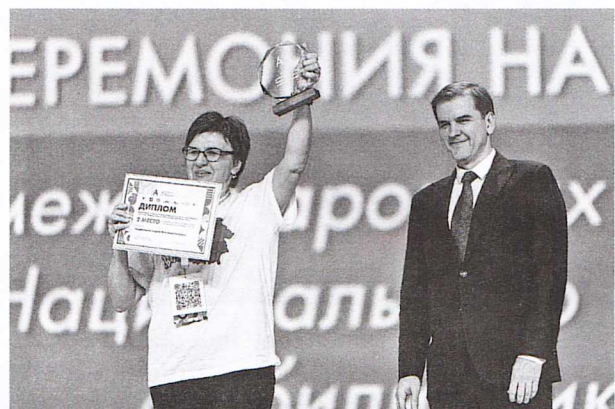
Вручение наград команде Республики Беларусь

На X чемпионате «Абилимпикс» впервые провели командные состязания, в которых представители разных специальностей, объединившись, создавали общий продукт. Для ребят это был отличный опыт командной работы, приближённый к реальным условиям.