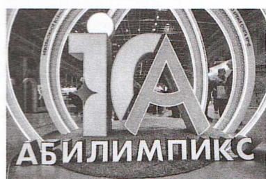
Эмблема национального чемпионата

А билимпикс (сокращение от английского Olympics of Abilities — ‘олимпиада возможностей’) — международные конкурсы профессионального мастерства для людей с инвалидностью, которые зародились в Японии и проводятся во многих странах мира с 1972 года.